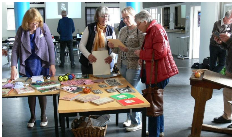
Stor interesse blandt de 29 medlemmer der var mødt op