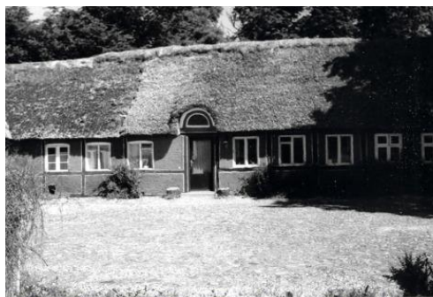
Min tipoldefars gård i Vindblæs, 1853, firelænget, rødkalket med stråtag.

bange for at kontakte den lokale befolkning, ofte byder de på store overraskelser.