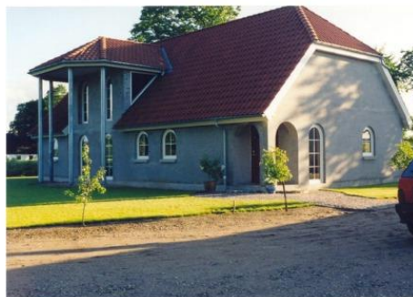
Min tipoldefars rødkalkede gård, anno 1999, unægtelig anderledes

Da jeg på hjemvejen kom til Aalborg for overnatning, kunne jeg jo lige så godt, runde bydelen Hasseris, for at fotografere det hus min bedstemoder har boet i, jeg har aldrig kendt eller set denne bedstemoder, det blev næsten overvældende da jeg så huset, for her har jeg som en stor dreng leveret mælk hver morgen igennem et helt år – uden at vide hvem der boede der.