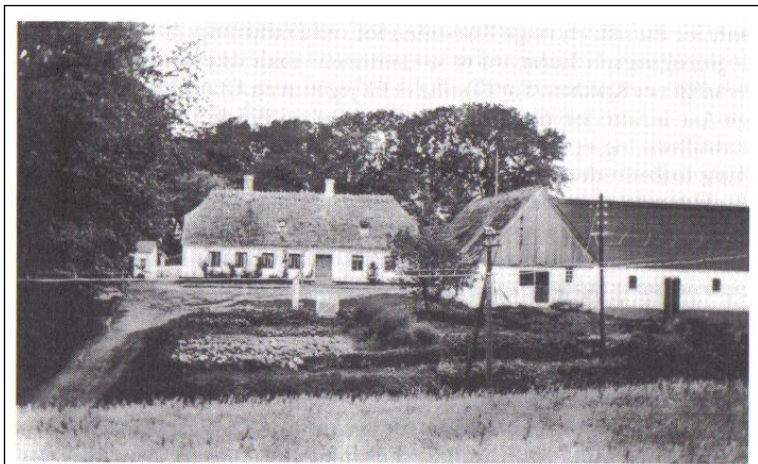
Høve skole opført 1834. 11 fag, 3 værelser, pigekammer, kælder, skolestue, 95 m 2 . (Privat eje).